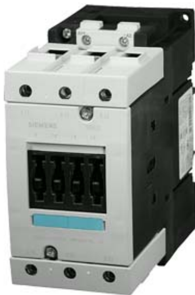
CONTACTOR, AC-3 45 KW/400 V, DC 24 V, 3-POLE, SIZE S3, SCREW CONNECTION